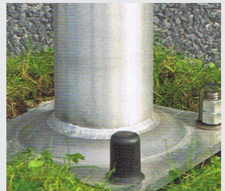
Forseglingen fjernes og hætterne klemmes ned over boltene. Leveres i sæt af 4 stk.