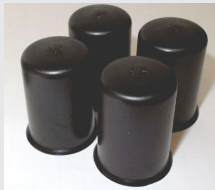
Beskyttelseshætter for fundamentsbolte. Hætterne indeholder konsistensfedt forsegllet i hætten.