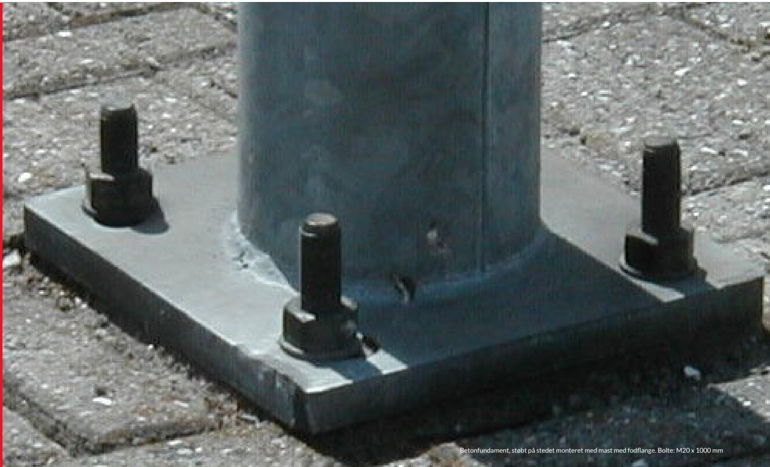
Betonfundament, støbt på stedet monteret med mast med fodflange. Bolte: M20 x 1000 mm