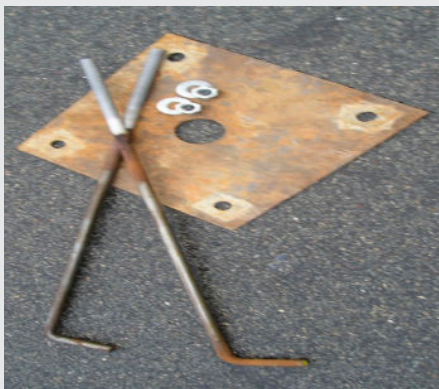
Fundamentsbolte med skiver og møtrikker samt støbeskabelon

Støbeskabelon hviler på betonoverflade til afhærdningen er foregået.